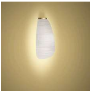
Rituals 1 Mix&Match