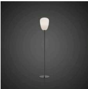
Rituals 1 Mix&Match