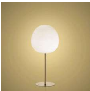
Rituals XL Mix&Match