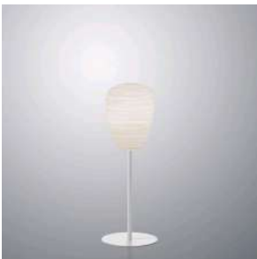
Rituals 1 Mix&Match