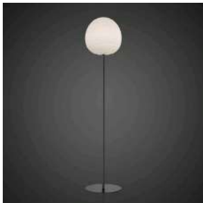
Rituals XL Mix&Match