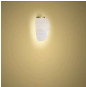
Rituals 3 Parete