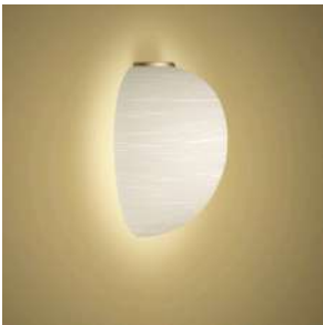
Rituals XL Mix&Match